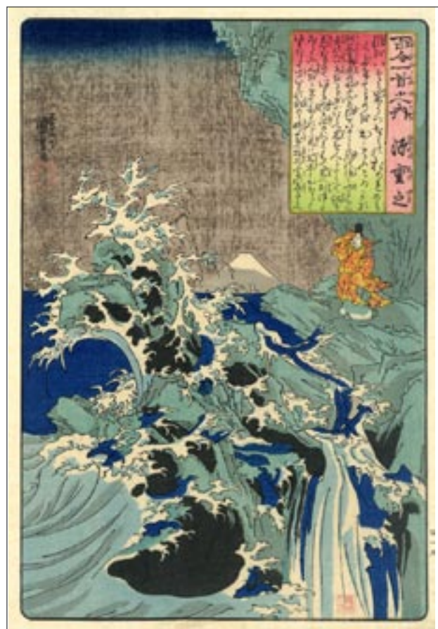
Boven: De dichter Minamoto no Shigeyuki op de rotsen', van Utagawa Kuniyoshi, ca 1840-1842, bij Hotei Japanese Prints.