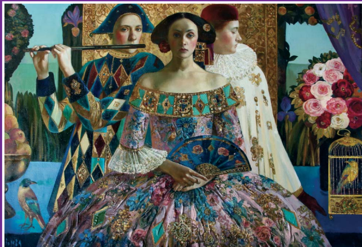
Olga Suvorova, 'Muziek', gemengde techniek op linnen, 2008, 170 x 120 cm – Galerie Rosarta – stand 86

Vanaf 24 februari tot en met 1 maart 2009 wordt de vierde editie van Primavera gehouden in Ahoy, Rotterdam.